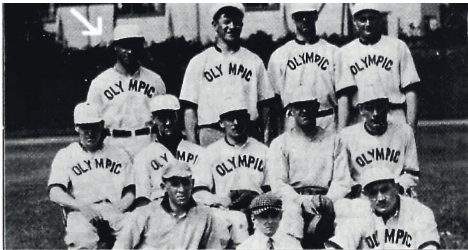
OLYMPIC GAMES AT STOCKHOLM, SWEDEN, 1912.